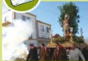
Fiestas de San Sebastián.