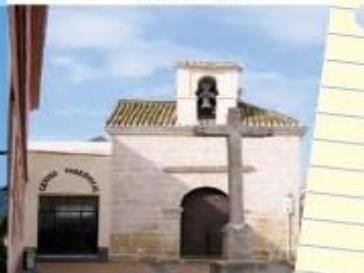
Ermita de San Sebastián.