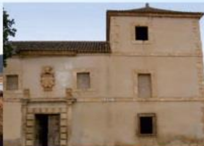
Casa Grande o Palacio de los Condes de Padul.