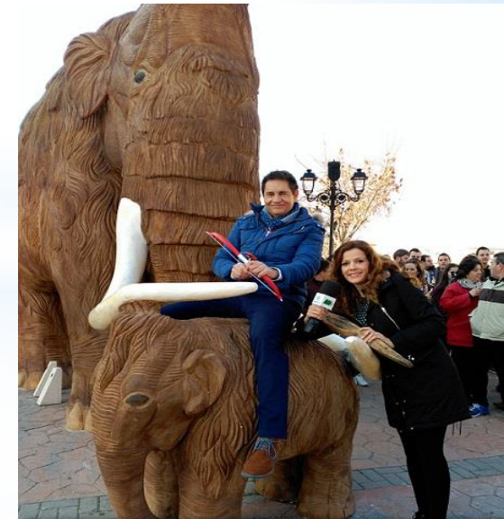
Este es mi Pueblo. Canal Sur