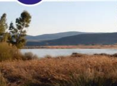
Laguna de Padul.