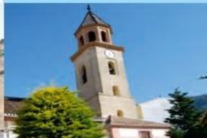
Iglesia Santa María la Mayor.