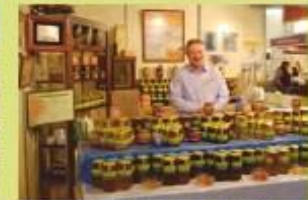
Feria del Turismo y la Artesanía.