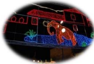
Feria del Ganado y Fiestas