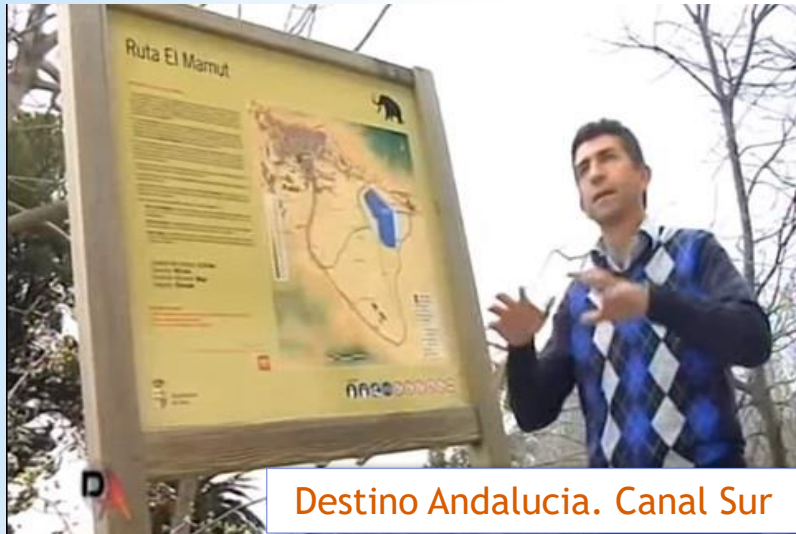
Destino Andalucía. Canal Sur