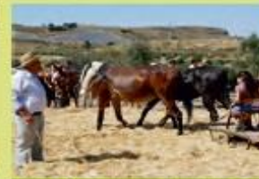
Feria Real de Granada y Fiestas.

Procesiones el Domingo de Ramos, Viernes Santo y Domingo de Resurrección.