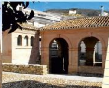
Fuente de los Cinco Caños y Lavadero.