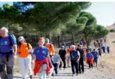
Sendero Padre Ferrer, Sierra del Manar.