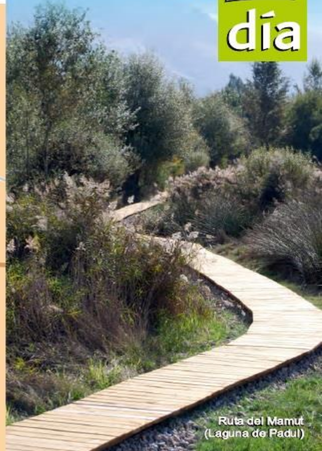
Ruta del Mamut (Laguna de Padul)